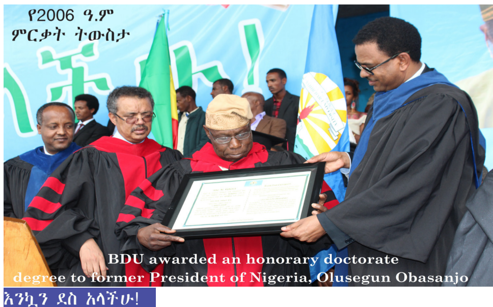
የ2006 ዓ.ም ምርቃት ትውስታ