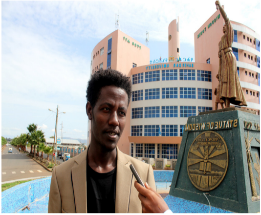
ሳይንስ ሳኬ የጉልማሶች ትምህርትና የማህበረሰብ ልማት ት/ክፍል ተማሪ

“የዩኒቨርሲቲ ዋና ዓላማ በዋናነት ብቁ ንቁና ለልማት ታታሪ ዜጋን ማፍራት ነው። ይህንን ግብ ዳር ለማድረስም የተለያዩ ተግባራት ይከናወናሉ። ለምሳሌ የተሳካ መማር ማስተማር እንዲኖር ተቋሙ ባስቀመጠው ደንብ መገዛት ተገቢ ነው። እኔም ደንቡን አከብራለሁ እንዲሁም እገዛበታለሁ። ምክንያቱም እኔን ትልቅ ሰው ለማድረግ ወይም ነገ ትልቅ ቦታ ለማድረስ የወጣ ደንብ እስከሆነ ድረስ ማክበር ይኖርብኛል። በመሆኑም ዩኒቨርሲቲ ማለት በመረጃ የተመሰረተ ሀሳብ የሚፈልቅበት፣ ብቃት ያለው ትውልድ የሚቀረጽበት፣ በምክንያትና በህግ የበላይነት የሚያምን ዜጋ የሚሰለጥንበት፣ ለሰው ልጅ አስፈላጊ የሆኑት ዕውቀት የሚገባበት ማዕከል ነው።”