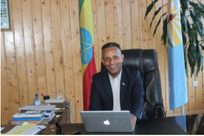
ባይሌ ዳምጤ (ዶ/ር) - ፕሬዚዳንት