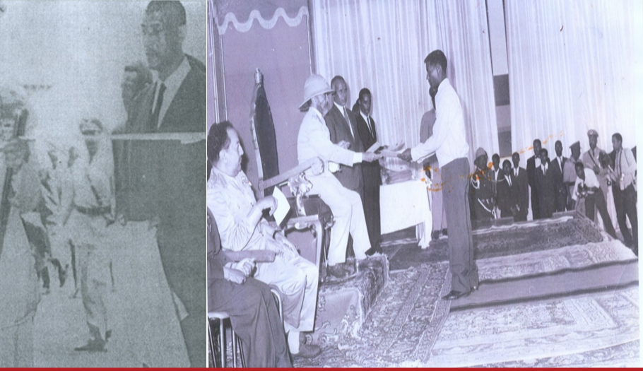
ቀዳማዊ ኃይለ ሥላሴ ተቋሙን መርቀው ሲከፍቱና የመጀመሪያ ሰልጣኞችን ሲሸልሙ

ስለዚህ በተቋሙ ሀገር በቀል ሙሁራን በመበራከታቸው ምክንያት በ1977 ዓ.ም ለመጀመሪያ ጊዜ የስርአተ ትምህርት ክለሳ አድርጓል። ስርአተ ትምህርቱን ለማሻሻል የተሰጠው ምክንያት ሀገራዊ መሰረት እንዲኖረው ለማድረግ እንደነበር መረጃዎች ይጠቁማሉ።